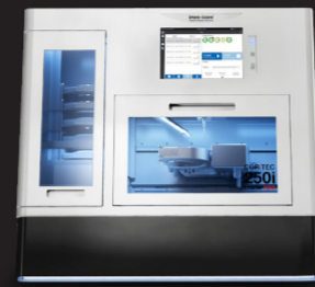
COR TEC 250i Loader PRO