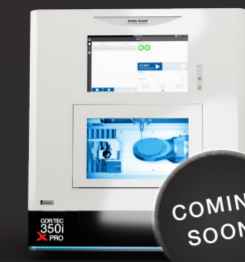
COR TEC 350i X PRO