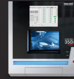
COR TEC 350i PRO+