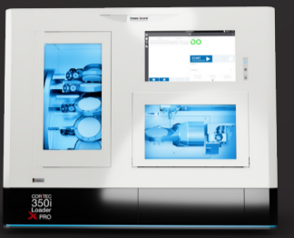
COR TEC 350i Loader X PRO