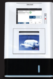
COR TEC 150i PRO