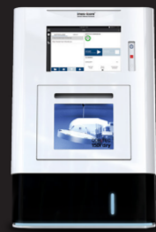
COR TEC 150i dry