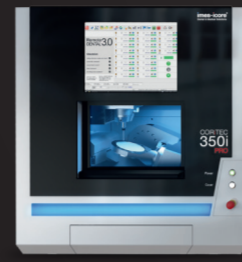
COR TEC 350i PRO