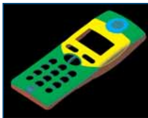
Import von Flächendaten / import surface datas

Ergänzung zu den Standard Import/Export-Datenformaten auf IGES und VDA-FS. Mit dieser Erweiterung können Sie die NC-Programme direkt auf IGES- oder VDA-FS- Flächendaten generieren, oder Sie nutzen die Importfilter, um Flächendaten im isy CAM 3.0 weiterzuverarbeiten, z.B. mit den leistungsstarken Funktionen "Healing (3D-Körper reparieren)" oder ACIS-Körper von Flächendaten erzeugen.