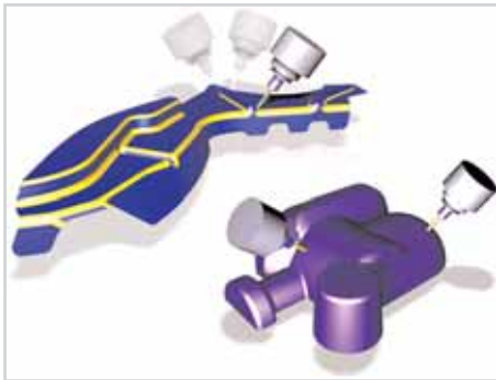
5-Achsen Simultan fräsen / 5 axis simultaneous milling

Die schnelle und effiziente 5-Achs-Simultanprogrammierung ermöglicht das Schruppen und Schlichten auf unterschiedlichen Flächen.