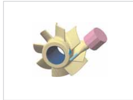
3+2-Achsen fräsen / 3+2 axis milling